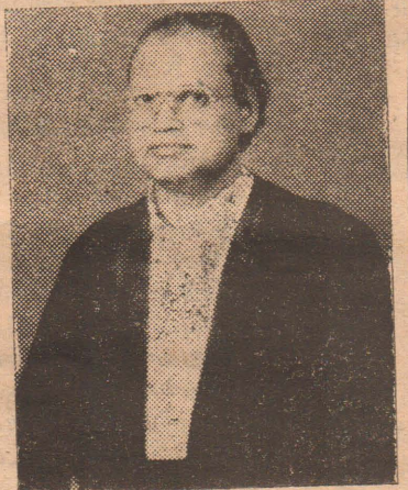
குருத்துவ வெண்பொன் யூபிலி விழாக்காணும் மன்றார்