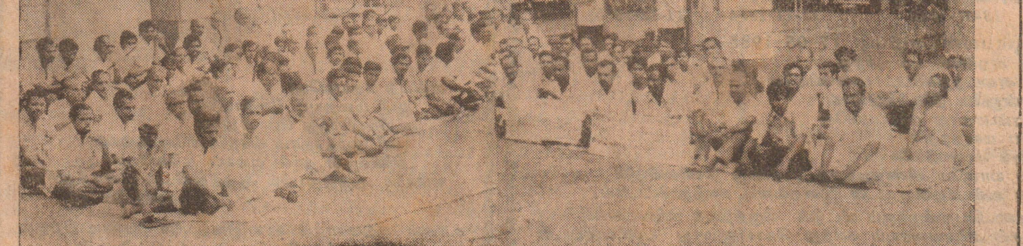
யாழ். ஐக்கியவியாபாரச் சங்க ஊழியர், சங்கத்தில் நடந்த கொள்ளைகளுக்கு எதிர்ப்புத் தெரிவித்து யாழ். நகரில் நடத்திய உண்ணாவிருத்திப்போது எடுக்கப்பட்ட படம்.

(யாழ்ப்பாணம்) கடத்தலை எதிர்த்து யாழ். நகரில் நேற்றுக்காலை, சுலோக யாழ் ஐக்கிய வியாபாரச் சங்கத்தைச் சேர்ந்த சுமார் அட்டைகளுடன் கோஷங்களை சங்கத்தலைமைக் காரியாலயத்தில் நேற்றுக்காலை, சுலோக யாழ் ஐக்கிய வியாபாரச் சங்கத்தலைமைக் காரியாலயத்தில் 200 ஊழியர்கள், கொடி, எழும்பியவாறு ஆர்ப்பாட்ட (8-ம் பக்கம் பார்க்க)