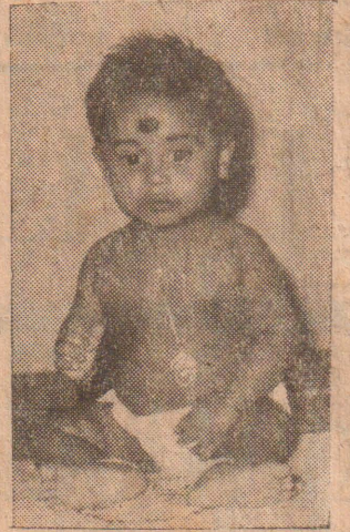
531/2, கே. கே. எஸ் வீதி, யாழ்ப்பாணம், 4041