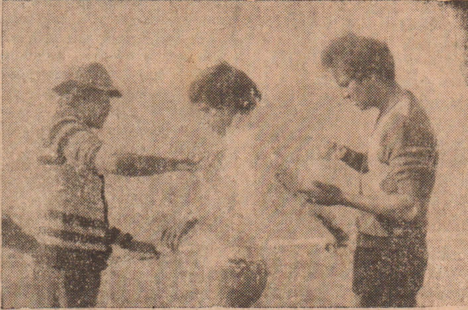
ஆங்கிலக் கால்வாயில் நீந்தமுன், அவருக்கு அங்கு கிறீஸ்பூசும் போது எடுத்தபடம்.

யாழ்ப்பாணத்தில் பிலியட்ஸ் தடியை மேலும் கீழுமாக உயர்த்துவதில் உலக சாத னையை ஏற்படுத்தும் நிகழ்ச்சியை வெற்றிகரமாக முடிக்கப் பல விதங்களிலும் என்னால் உதவ முடிந்ததனை ஒரு பாக்