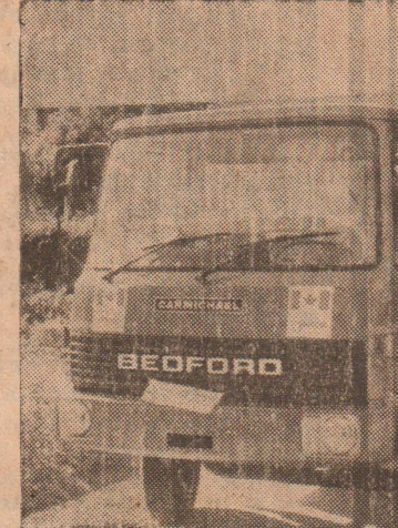
சாதனத்தின் தாண்டி... சாதனத்தின் தாண்டி... சாதனத்தின் தாண்டி...