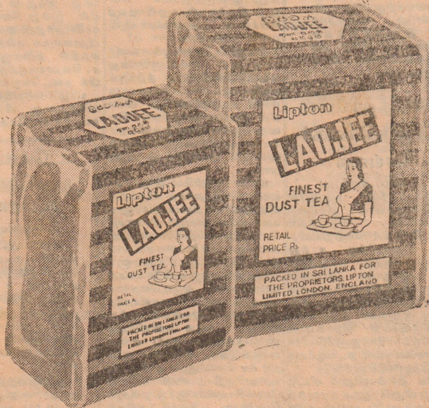
லிப்டன் லாவோஜி அதி சிறந்த தேயிலைத் தூள்.

லிப்டன் சிலோன் லிமிட்டெட், த. பெ. எண் 86, கொழும்பு.