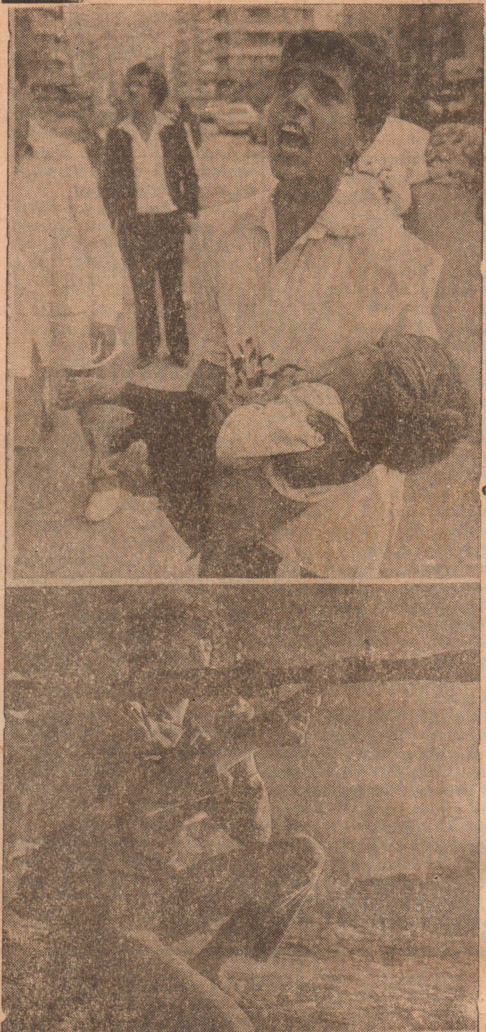
கிழக்கு வெளியில் இஸ்ரேலிய ஜெட் போர் விமானங்கள் தொடர்ந்து குண்டுமாரி பொழிந்து வருகின்றன. குறிப்பாக ஷியா முஸ்லிம் தீவிரவாதிகள் குடியிருக்கும் பகுதிகளிலேயே பலத்த குண்டுத் தாக்குதல்கள் நடக்கின்றன! நேற்று முன்தினம் பெய் ரூட்டில் இடம்பெற்ற குண்டுத் தாக்குதலில் நூற்றுக்கும் அதிகமானவர்கள் கொல்லப்பட்டனர். 400 பேர் பலி தகாயமடைந்தனர்.