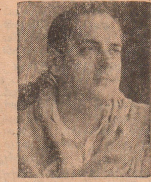
[புதுடில்லி] “இலங்கையில் உள்ள ஆயுதப்படைகள் நிதானத்துடன் செயல்படவேண்டும். இலங்கையில் நிலவும் பதற்றமான சூழ்நிலை கவலை தருவதாக உள்ளது” என்று இந்தியப் பிரதமர் திரு. ராஜீவ் காந்தி தெரிவித்துள்ளார்.