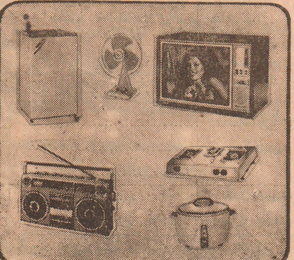
துணிச்சலாகவும், கோட்டாவிடம் பெற்றிருக்கிற உட்கள் மாதிரியும், மின்சார சமையல் உபகரணங்களை வீட்டுத்தொழில்நுட்பம் முதலியவற்றைப் பெற்றுக்கொள்ளலாம்.