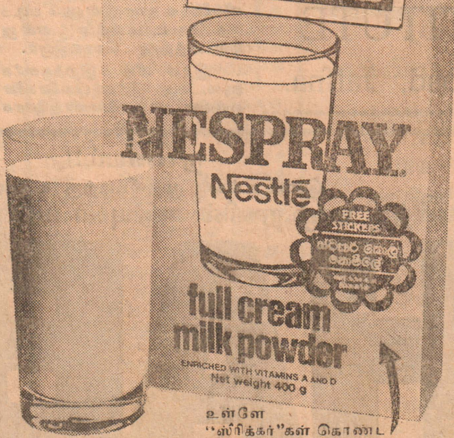
நெஸ்பிரே 400 கிராம் ரூபாய் 24/-

உள்ளே "ஸ்ரீக்கர்"கள் கொண்டு தான் இருக்கிறதா என்பதை உறுதிப்படுத்திக் கொள்ளுங்கள்.