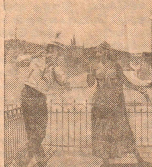
கதை—ஸ்ரீதேவி—தீப மீண்டும் கோகிலா (சஸ்மன் கவர்) இன்களின் இன்பக் காணியம்

ராஜா (காழ். நகர்) தினசரி 10-30, 2-30, 6-00 9-00 இந்தியாவில் முதல்முறை திரையிடப்போகும் தடைசெய்யப்பட்டு மீண்டும் திரையிடப்பெறும் 175 நாட்களுக்கு மேல் ஓடி வரும் சாதனை நிறைநாட் டி உடையது.