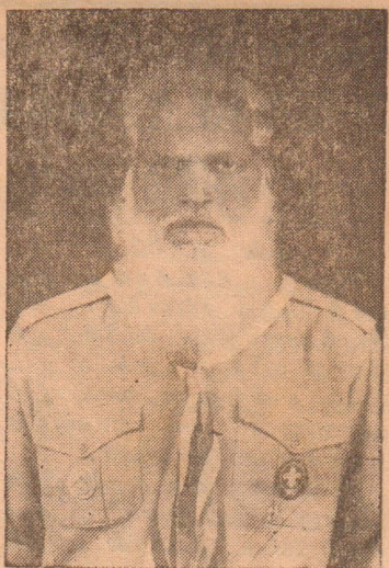
“சேவையை வாழ்வாக கொண்டவர்”