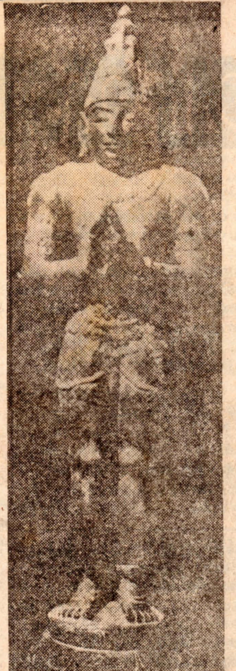
தஞ்சைக்காயல அபிவருத் திக்கு தமிழ்நாடு அரசு ஏழரை லட்சம் ரூபாயை ஒதுக்கியுள்ளது.

நாளை 1000வது ஆண்டு முடிசூட்டுவிழா தஞ்சைக் கோவிலினுள் ராஜராஜசோழன் சிலை! (சென்னை) தென்ற பிரச்சனையில் மத் தஞ்சை பெரிய கோவி திய அரசு இதுவரை அனு லுக்குள் ராஜராஜசோழன் மதி வழங்காமல் இருந்து சிலையை பிரதமர் திருமதி வந்தது. ஆனாலும் பாரத இந்திராகாந்தி நிறுவவ தொல்பொருள் இலாகா தற்கு அங்கீகாரம் அளித் வுடன் ஆராய்ந்து. மத துள்ளார். நாளை ஞாயிற் கட்சித் தலைவர்களுடன் றுக்கிழமை தஞ்சைக் பேசி, கோவிலினுள் கோவிலில் நடக்கும் சிலையை நிறுவவதென்ற 1000வது முடிசூட்டு விழா கோரிக்கைக்கு அனுமதியை பிரதமர் இந்திரா வழங்கியுள்ளார் பிரதமர் காந்தி கலந்துகொள்கிறார். வழங்கியுள்ளார் பிரதமர் சிலையை உள்ளே நிறுவவ இந்திரா.