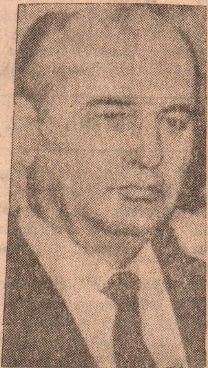
இடைநிறுத்தத்தை சோவியத் அதிபர் நீடித்துள்ளார்.

இதன் அடிப்படையிலேயே புதிய ஆண்டில் மார்ச் மாதம் வரை அணுஆயுத பரிசோதனை