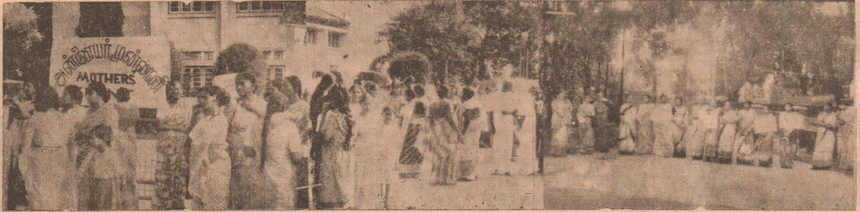
அன்னை முன்னணியின் மறியல் போராட்டத்தின்போது எடுக்கப்பட்ட படங்கள். செயலகம் முன்பாக சுலோக அட்டைகளுடன் அன்னை முன்னணியினர் நிற்பதை இங்கு காணலாம்.

சம்யாந்துறை, வீரமுனை, சொறிக்கல்முனை ஆகிய பகுதிகளில் வாழும் தமிழ்முஸ்லிம் மக்களிடையே ஒற்றுமையை யும் நல்லெண்ணெயையும் ஏற்படுத்தும் நோக்குடன் அந் தப்பகுதிகளில் தமிழ்-முஸ்லிம் பிரமுகர்கள் ஒற்றுமைக்கூட்டம் ஒன்றை ஏற்பாடு செய்துள்ளனர். [ச-ய]