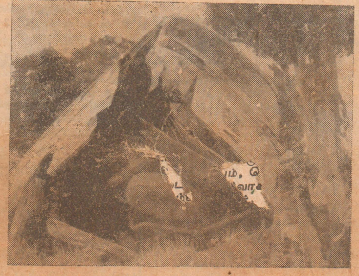
கிளிநொச்சியில் தென் இந்திய யாத்திரிகர்களுடன் சேர விபத்திக்குள்ளாகி ஸ்தலத்திலேயே இருவரை பவி எடுத்த மினி பஸ்ஸின் தோற்றத்தை இங்கு காணலாம்.