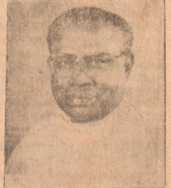
வடஇந்திய அரசியல் தலைவர்களையும் தாம் சந்திக்கக்கூடும் எனவும் அவர் மேலும் தெரிவித்தார். [ஷ]

சந்தித்துப் பேச்சுவார்த்தை நடாத்தவிருக்கிறேன்” இன்று அதிகாலை இந்தியா யுறப்படுமன்னர் ‘ஈழநாடு’க்கு அளித்த பிரத்தியேக பேட்டியின்போது கிராமியக் கைத் தொழில் அபிவிருத்தி அமைச்சர் திரு. எஸ். தொண்டமான் மேற்கண்டவாறு தெரிவித்தார்.