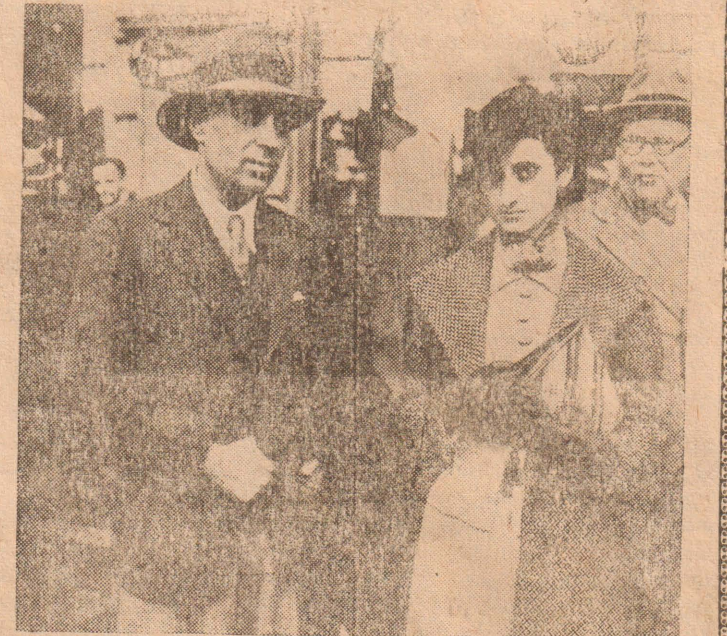
1938-ம் ஆண்டு அமரர் ஜவஹர்லால் நேரு தமது ஓரேமகள் இந்திராவுடன் செக்கோஸ்லவாக்கியாவுக்கு விஜயம் செய்த போது இப்படித் தோற்றினார்கள்.

தமது தந்தையாரின் பணிகளுக்கு இடைஞ்சலாக இருந்தவர்களையும் இனங்கண்டு கொண்டார். நேருஜியின் மறைவுக்குப்பின் அந்த எதிர்சக்திகளை யெல்லாம் முறியடிக்க வேண்டிய கட்டாயமும் அவருக்கு ஏற்பட்டது. தேசிய சர்வதேசிய மட்டங்களில் உருவான பல்வேறு சவால்களையும் ஒரு பெண்ணாக இருந்தும் கூட மிகுந்த துணிச்சலுடன் அவர் எதிர்கொண்டு சமாளித்த