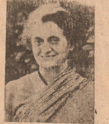
“தேசிய சர்வதேசிய மட்டங்களில் உருவான பல்வேறு சவால்களையும் ஒரு பெண்ணாக இருந்தும் கூட மிகுந்த துணிச்சலுடன் சமாளித்து இந்தியாவை ஒரு தன்னிகரில்லா தலைமை நிலைக்கு உயர்த்தியுள்ளார்”

பதைத் தீர்மானிப்பதில் மதிநுட்பம் படைத்தவரான இந்திரா காந்தி உள்நாட்டு விவகாரங்களிலும், சர்வதேசப் பிரச்சனைகளிலும் தமது இத்திறமையை வெளிப்படுத்தியிருக்கிறார்.