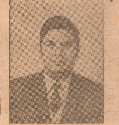
சுதந்திர தினச் செய்தி

டுத்தாபன பொது முகாமை யாளருக்கு நேற்றுமுன்தினம் பிற்பகல் அனாமதேய தொலைவைக்கப்பட்டுள்ளதாக கூட்