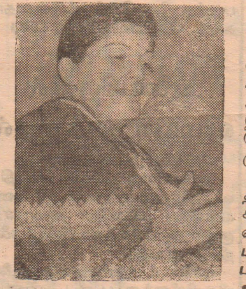
அவர்கள் வளர்ந்துவிட்டார்கள். இதற்குக் காரணம் ஏற்கனவே இம்மாநிலத்தில் ஆட்சியிலிருந்த தி. மு. க. தான். மாநில அரசு அவர்களுக்கு ஊக்கமும் ஆதரவும் தரவில்லை

போராளிகள் இங்கு ஆழமாக வேருன்றிவிட்டார்கள். என்பது எல்லோருக்கும் தெரியும். எல்லோரும் ஒன்றை புரிந்து கொள்ள வேண்டும். இலங்கைப் போராளிகள் தமிழகத்தில் நல்ல பலமுள்ளவர்களாக சக்திவாய்ந்த ஒரு இயக்கமாக யென்றால் அவர்கள் இங்கே ஊடுருவியிருக்க முடியாது. செயல்பட்டிருக்க முடியாது; அதனால் ஆட்சியிலுள்ள மாநில அரசு மனதுவைத்தால் இவர்களுடைய சட்டவிரோத தவறான காரியங்களை நிறுத்தியிருக்க முடியும்; தடுக்க முடியும். உண்மையாக தமிழகத்தில் அடைக்கலம் தேடி வந்திருக்கின்ற அகதிகளுக்கும் போராளிகளுக்கும் வித்தியாசம் உண்டு. அகதிகளிடம் எங்கள் அணுகுமுறை வேறுவிதமாக இருக்கும். போராளிகளைப் பொறுத்தவரை எமது அணுகுமுறைவேறுவிதமாக இருக்கும். உண்மையான அகதிகளுக்கு தாயுள்ளத்தோடு நாம் கருணை காட்டுவோம். இன உணர்வின் அடிப்படையில் மட்டுமல்ல மனிதாபிமான அடிப்படையிலும் அவர்களுக்கு உடனடி உதவியும், அவர்களுக்கு சட்டத்திற்கு விரோதமாக அனுமதியின்றி யார் ஆயுதங்கள் வைத்திருந்தாலும் அவர்களை உடனடியாக கடுமை கையாண நடவடிக்கை எடுக்கப்படும்.