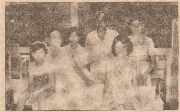
செல்லரிக்கப்பட்ட நிலையில் 'ஷெல்' விழுந்த குடும்பம்