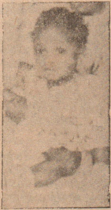
'எய்ட்ஸ்' நோயினால் பாதிக்கப்பட்ட சிறுவன்

81-ம் ஆண்டி நடுப்பகுதியில் கலிபோர்னியா மாநில டாக்டர் ஒருவர் தன்னிடம் சில நோயாளிகள், அனைவரும் தன்னிசைச் சேர்க்கையில் நாட்டம் உடையோர், ஒரு அசாதாரண ஆனால் கொடிய (P. C. P. எனப்படும்) நிமோனியாக் காய்ச்சலொன்றினால் பீடிக்கப்பட்டிருந்ததுடன், அவர்களது உடலிலுள்ள இயற்கை நோய் எதிர்ப்புச் சக்தி முற்றாக அழிந்திருப்பதையும் அவதானித்தார்.