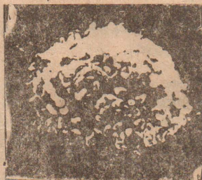
HTLV III வைரஸின் உருப்பெருத்த தோற்றம்

மனிதனின் உடம்பினுள் சாதாரண கிருமிகள் இனவிருத்தி செய்வதைவிட சுமார் 1000 மடங்கு விரைவாக எய்ட்ஸ் இனவிருத்தி செய்வதாகக் கணிப்பிடப்பட்டுள்ளது. வைரஸ் தாக்கியுள்ள ஒரு வெ. குழியத்தை, புதிய வைரசுகளை வேகமாக உற்பத்தி செய்யும் வண்ணம் ஒரு புரதப்பொருளை இந்த வைரஸிலுள்ள ஒரு தாதுப்பொருள் உருவாக்குவதாக ஒரு நிபுணர் குறிப்பிடுகிறார்.