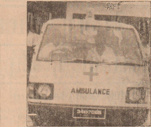
அண்மையில் தமிழ் மாணவர் பேரவையினால் [ரெலோ] ஆம்பிளென்ஸ்கள் மூன்று சிசிசைப் பிரிவுக்காகப் பயன்படுத்தப்படும் 'அம்புலன்ஸ்' வாகனம்.

பிரதோஷ தினத்தன்று மாலை 4-30—6-30 மஞ்சள் வெயில் காயும் வேளை பிரதோஷ காலம். பாவத்தை போக்கக் கூடிய அவ்வேளையில் நந்தியின் இரு கொம்புசுருக்கடாக சிவலிங்கத்தை தரிசிப்பதால் முற்பிறவிகளிலும் இளமையிலும் செய்த பாவங்கள் நீங்கி பெருவாழ்வும் மோட்சமும் கிட்டும். பிரதோஷ காலத்தில் நந்திக்கு பூசையாகிய பிந்தான் சிவலிங்கத்துக்கு பூசை. நந்தியும் பெருமானும் குள்ள பெருமதிப்பை ஆப்பூசை நமக்கு உணர்த்துகிறது. பண்பை போற்றி பின்பற்றினால் நற்கதி உண்டு.