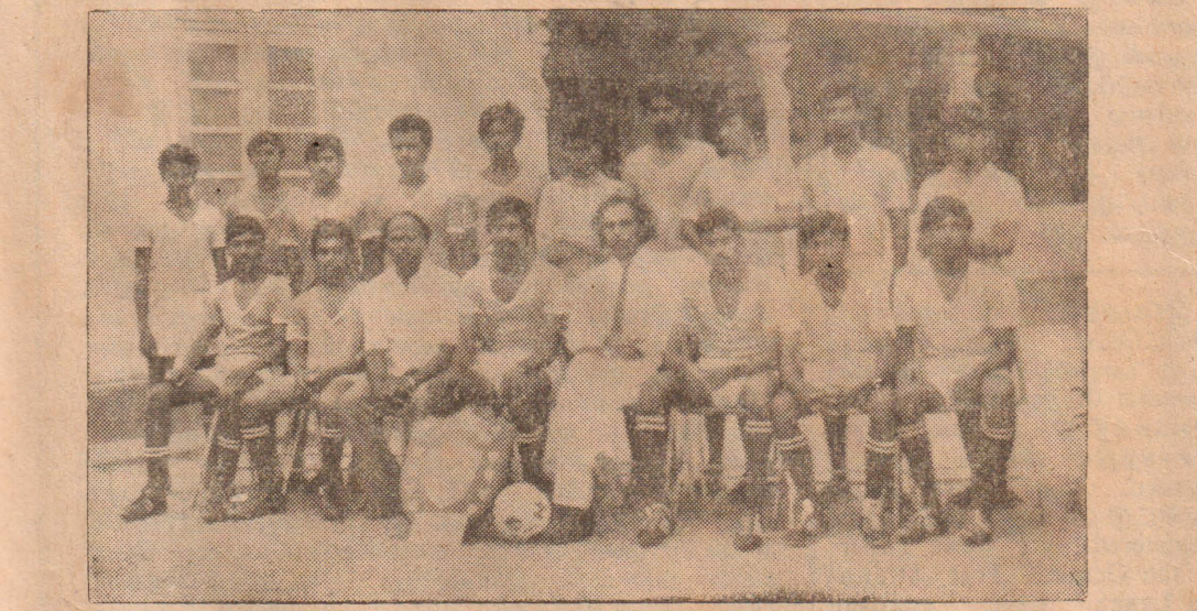
1986-ம் ஆண்டு யாழ்ப்பாணம் கல்வித்திணைக்களத்தினால் நடாத்தப்பட்ட உதைபந்தாட்ட சுற்று போட்டியில் தோற்கடிக்கப்படாத (19 வயதின் கீழ்) மகாஜனக் கல்லூரி முன்னணி வீரர்கள்.