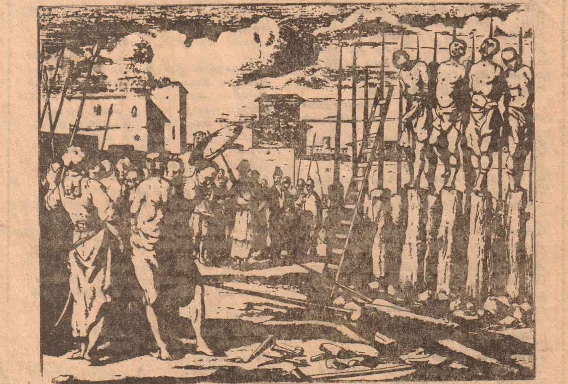
மட்டக்களப்பில் கைதானவர்கள் கழுவேற்றுப்படுவதைப் படம் சித்திரிக்கிறது.