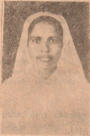
அருட் செல்வி. யூபிறேசியா லம்பேட்

தாயின் மடியில் 18-12-1941 முதல் அர்ப்பணம் 18-2-1961 இறைவன் அடியில் 13-8-1990