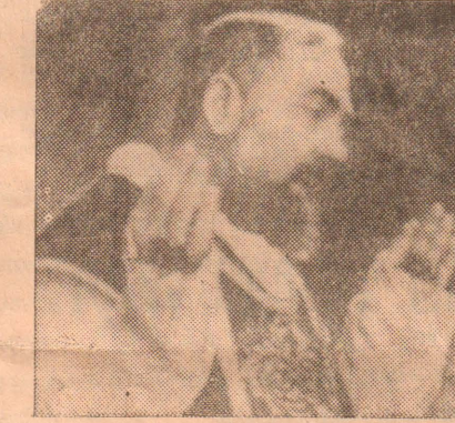
அருள் தந்தை பியோ தோற்றம் 25-05-1887 மறைவு 23-09-1968