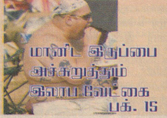
மாநில இருப்பை அச்சுறுத்தும் இலாப வேட்கை பக். 15