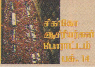
சீக்கிரோ ஆசிரியர்கள் போராட்டம் பக். 14