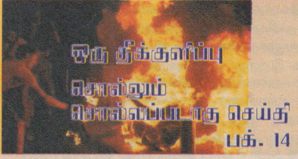
ஒரு தீக்குளிப்பு சொல்லும் சொல்லப்படாத செய்தி பக். 14