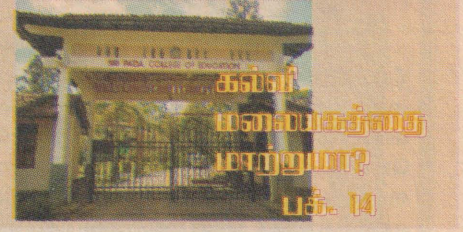
கல்வி மனலயகத்தை மாற்றுவா? பக். 14