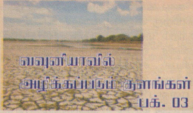
வவுனியாவில் அழிக்கப்படும் குளங்கள் பக். 03