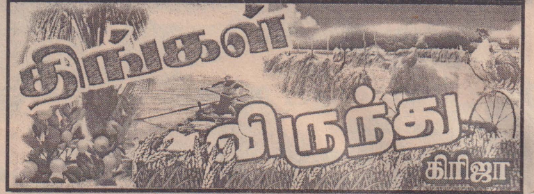
திங்கள் விருந்து கிரிஜா

விவசாயிகள் அனைவரும் புதிய நெல் வர்க்கத்தை தெரிவு செய்வதாயின் விவசாயத் திணைக்களத்தால் அத்தாட்சிப்படுத்தப்பட்ட விதைகளை உள்ளடக்கிய நெல்லினங்களையே தெரிவு செய்ய வேண்டும். இவ்வாறு அத்தாட்சிப்படுத்திய விதை இனங்களை செய்கை பண்ணைப் போது விவசாயிகள் எதிர்பார்க்கும் விளைச்சலை அதிகரிக்கலாம் என்பது விவசாய ஆய்வு நிலையங்களின் கணிப்பீடாகும்.