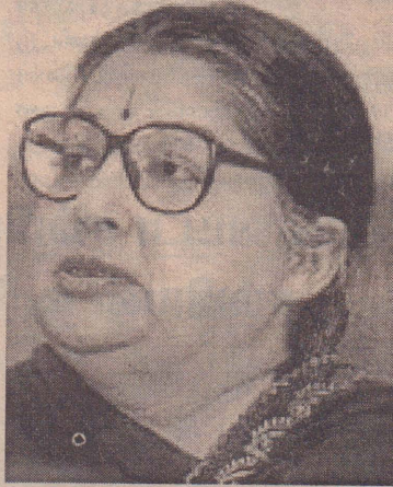
ரணைக்கு எடுத்துக் கொள்ளப்படவுள்ளது.

நவம்பர் மாத இறுதியில் மொழிபெயர்ப்பு பணிகள் பூர்த்தியடைந்து விடும் என்று எதிர்பார்க்கப்படுகின்றது. எதிர்வரும் டிசம்பர் மாதம் ஜெயலலிதா மீதான வழக்கு பெங்களூர் சிறப்பு நீதி மன்றத்தில் விசா