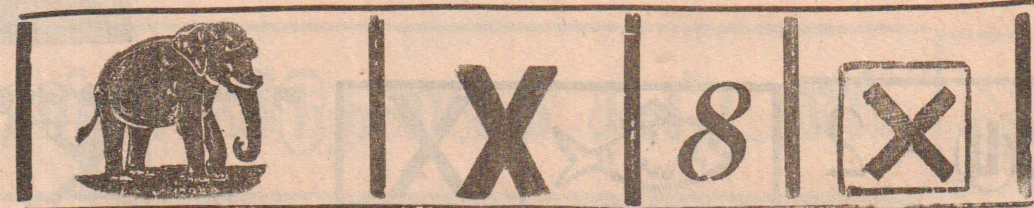
இல: 8ல் உங்கள் X யைப் போடவும்