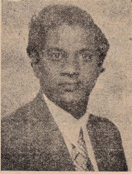
எங்கள் தமிழ்த் திரு. அரிமா வளங்கோ (பாரிசு)

நாடு (குமரிக் கண்டத்திற்கு மேலையர் இட்ட பெயர்) நச்சு