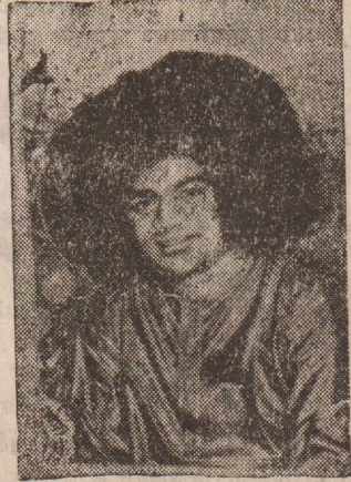
காரம் எடுப்பதைக் கூடத் தேவையில்லை என்ற நிற்பாட்டி விட்டார் பகவானின் எழுபத்தாறாவது அத்வையில் சுவாமி சூறிய மனித மேம்பாட்டு தத்துவங்களால் எமதுபிறவியின் உண்மையான நோக்கத்தை அடைய உதவுமாறு சாயிசனை வாழ்த்திவணங்கு வோமாக.

பகவான்பாபா ஒவ்வொரு பிறந்த தின விழாவிலும் எனது உடலுக்குத் தான் நீங்கள் பிறந்த தினம் கொண்டாடுகிறீர்கள். எனக்கு பிறப்பு மில்லை. இறப்பு மில்லை, நான் உங்களுடே சேர்ந்து உலாவித்திரிவதாலும் உங்களைப் போல் உண்பதாலும் ஒரு சர்வசாதாரணமான மனிதன் என்னும் மயக்கத்தில் விழக்கூடும். உங்களுடே சேர்ந்து பாடுவதாலும் ஆனந்தமாகக் கதைப்பதாலும் நானுமே உங்களை மாயையில் மயங்குகிறேன். அன்புடன் சொல்லொன்றைப் பேசுவது களைத்துச் சோர்வடைந்திருக்கும் கால்களுக்கு சுகமளக்கும் கனிம்பு போன்றது. பல இடங்களிலிருந்து அன்பினால் ஈர்க்கப்பட்டு பல வித கஷ்டங்களை அனுபவித்து பிரசாந்தி நிலையத்தை நாடி வருகின்றீர்கள். உங்களைக் கண்டவுடன் ஒன்றும் தெரியாததுபோல ஆ எப்பொழுது இங்கே வந்தீர்கள் என்று கேட்கிறேன். பாபா ஏன் இப்படிக்கேட்கிறார் என்று பிறருக்கோ சந்தேகமாக இருக்கும். அவருக்கு தெரியாதா? நிச்சயமாக அவருக்கு தெரியும் அப்போ ஏன் இந்த விசாரணை ஒருவர் பிரசாந்தி நிலையத்திற்கு வந்தவுடன் உங்களை நான் இப்படி விசாரிப்பதால் உங்களுக்கு எவ்வளவு ஆனந்தம் ஏற்படும், இதுவே யோசனையை.