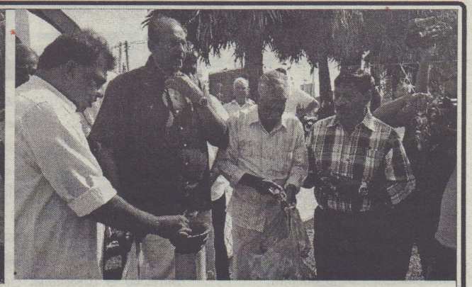
நான்காவது உலக தமிழ் ஆராய்ச்சி மாநாட்டில் படுகொலை செய்யப்பட்ட 9 தமிழர்களின் 42 ஆம் ஆண்டு நினைவு நாள் யாழ்.வீரசிங்கம் மண்டபத்தின் முன்பாகவுள்ள நினைவிடத்தில் நேற்றைய தினம் நினைவுசூரப்பட்டது. 1974 ஆம் ஆண்டு உலக தமிழ் ஆராய்ச்சி மாநாட்டின் போது பொலிஸாரின் தாக்குதலில் மின் கம்பிகள் அறுந்து வீழ்ந்ததில் 9 பேர் உயிரிழந்தனர். இந்த நினைவு சூரல் நிகழ்வில் மதகுருமார், நாடாளுமன்ற உறுப்பினர்கள், வட மாகாணசபை உறுப்பினர்கள், கட்சி பிரமுகர்கள் என பலர் கலந்து கொண்டனர்.

கல்வியை கண்ணென போற்றும் யாழ்ப்பாணத்தில் ஆங்கில கல்வியில் மீண்டும் தலை நிமிர்ந்து நடக்க காலத்தின் தேவைக்கேற்ப ஆங்கில கல்வியை வழங்கிட புதிய பாய்ச்சல்