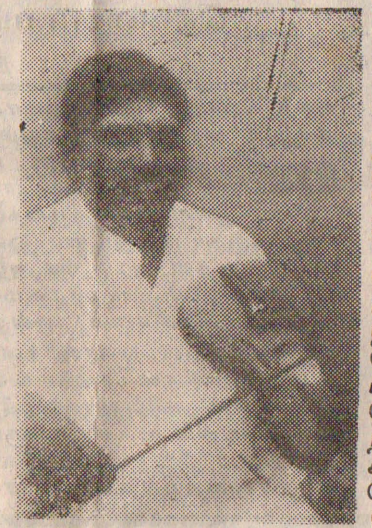
ஓட்டிக் கொண்டு இருக்கப் போகிறார்கள்?

யாராவது 'நாசாமணி' என்ற ஜன்ய ராகத்திற் பாடிக்காட்ட முன்வருவார்களா? முன்வந்தால் அது பரிசோதனை முயற்சியாகவும் புதிய தொரு அனுபவத்தைக் கர்நாடக சங்கீத ரஸிகர்களுக்குத் தருவதாகவும் அமையுமே. எவ்வளவு காலத்துக்குத்தான் நம்முடைய வித்துவான்கள் குண்டுச் சட்டிக்குள் குதிரை