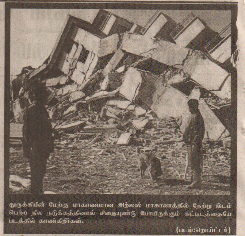
துருக்கியின் மேற்கு மாகாணமான அறல்ஸ் மாகாணத்தில் நேற்று இடம்பெற்ற நில நடுக்கத்தினால் சீதையுண்டு போயிருக்கும் கட்டிடத்தையே படத்தில் காண்கிறீர்கள்.

6 ரிச்சர் அளவு பதிவாகியுள்ள இந்த நிலநடுக்கம் தொடர்ந்தும் அப்பிரதேசத்தில் சற்றுக் குறைந்த அளவில் அதிர்வுகள் இருப்பதாகவும், உயிரிழந்தோரின் எண்ணிக்கை மேலும் அதிகரிக்கலாம் எனவும் அஞ்சப்படுகின்றது. இதேவேளை நிலநடுக்கத்தால் பாதிக்கப்பட்ட பிரதேசத்தை துருக்கிய பிரதமர் சுற்றிப்பார்த்து வருவதாகவும், சேத மதிப்பீடுகள் இடம்பெற்று வருவதாகவும், செய்தி ஊடகங்கள் தகவல் வெளியிட்டுள்ளன. கடந்த 1998ம் ஆண்டு துருக்கியில் இடம்பெற்ற நிலநடுக்கத்தில் 18ஆயிரம்பேர் பலியானமை இங்கு குறிப்பிடத்தக்கது. (இ)