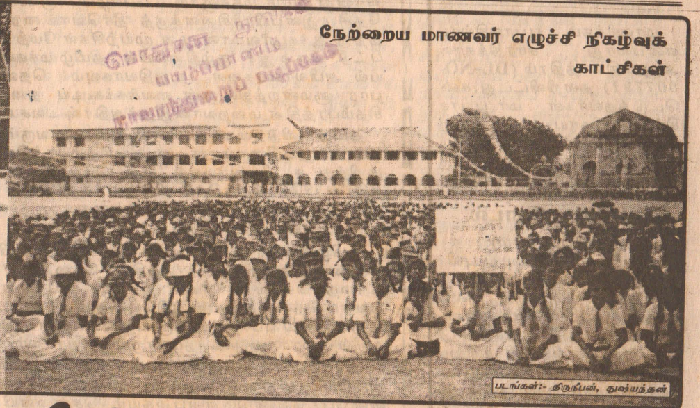
நேற்றைய மாணவர் எழுச்சி நிகழ்வுக் காட்சிகள்