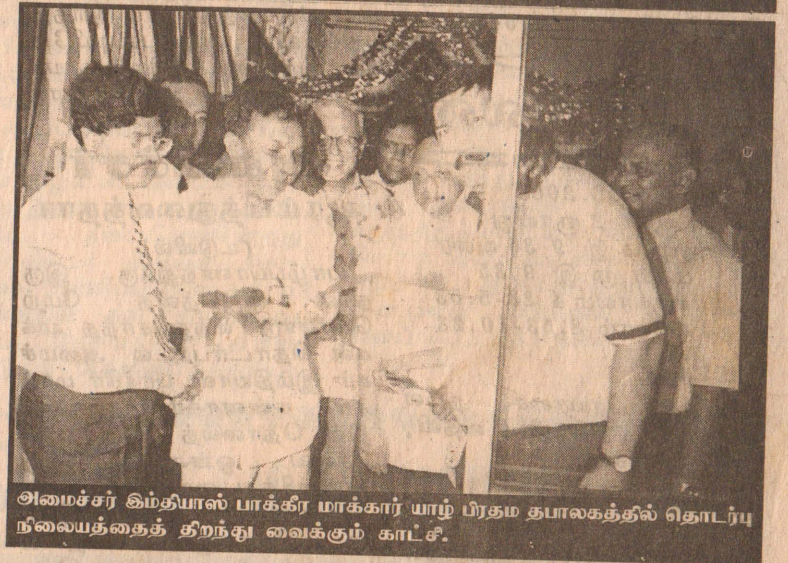
அமைச்சர் இம்தியாஸ் பாக்கீர் மாக்கார் யாழ் பிரதம தபாலகத்தில் தொடர்பு நிலையத்தைத் திறந்து வைக்கும் காட்சி.