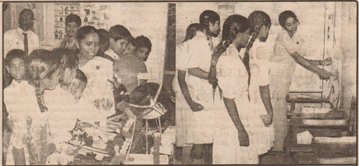
யாழ்ப்பாணம் தேசியக் கல்வியியற் கல்லூரியில் நடைபெறும் கல்வியியற் கண்காட்சி மாணவர்கள் பார்வையிடுவதை படங்களில் காணலாம்.

களி உண்பதற்கு இன்னொரு வழியிருக்கின்றது. காடி தோய்த்து களி உண்பது. ஒரு மண் பாத்திரத்தில் பணம்பழத்தோகையை (தோலை) உரித்து எடுத்து சிறு பழப்பூளியும் நீரும் சேர்த்துத் தோலை ஊறவிட்டு அடுத்த நாள் அதன் கலவையில் பணம் பழத்தைப் பிசைந்து உண்ணுதல். இது மிகச் சுவையானதும் ஒரு வேளை உணவாகக் கூடக் கொள்ளக் கூடியதுமாகும். பஞ்சமாத வேளையிலும் உணவுத் தேவைக்கும் முன்னோர் இந்த