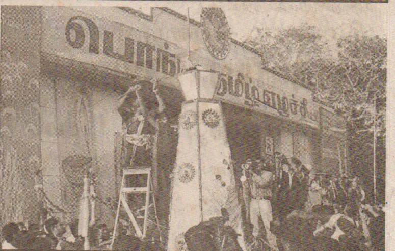
வவுனியா பொங்கு தமிழ்க் காட்சிகள்

தமிழ் மக்களின் அபிமானங்களையும் சுயநிர்ணய உரிமைகளையும் அங்கீகரிக்க வேண்டுமென்று கோரி நேற்று வவுனியா நகரில் பெருமெடுப்பில் உணர்வு பூர்வமாக பொங்கு தமிழ் எழுச்சி நிகழ்வு அனுஷ்டிக்கப்பட்டது. மன்னார் வீதி, யாழ் வீதி, நிகழ்வை சிறப்பிக்கும் வகை கண்டி வீதி, ஹொறாவப்பொத்தானை வீதி, பூந்தோட்டம் சந்தி ஆகியவற்றிலிருந்து அலங்கார ஊர்திகளுடன் புறப்பட்ட மக்கள் எழுச்சி ஊர்வலங்கள் மாலை 6 மணியளவில் வவுனியா நகரசபை மைதானத்திற்கு வந்து சேர்ந்தது. (8ம் பக்கம் பார்க்க)