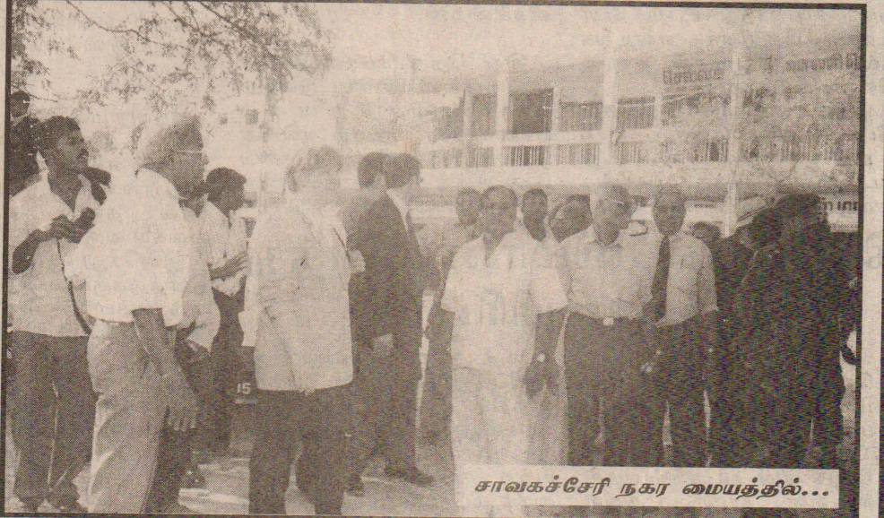
சாவகச்சேரி நகர மையத்தில்...