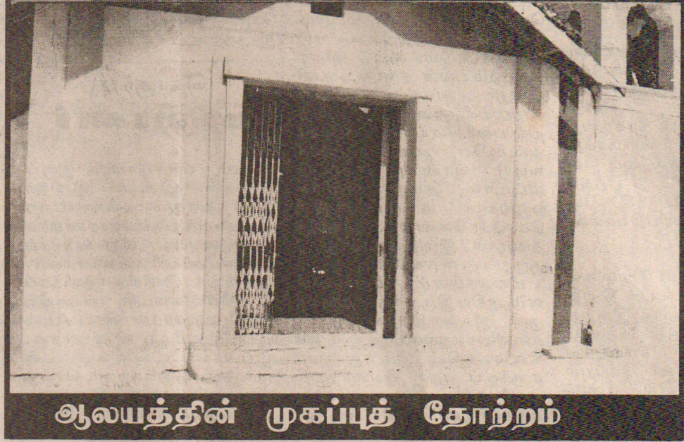
ஆலயத்தின் முகப்புத் தோற்றம்