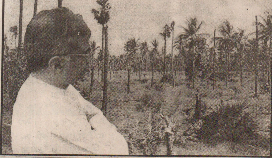
சேதமடைந்த தென்மராட்சியைப் பார்வையிட்ட போது...