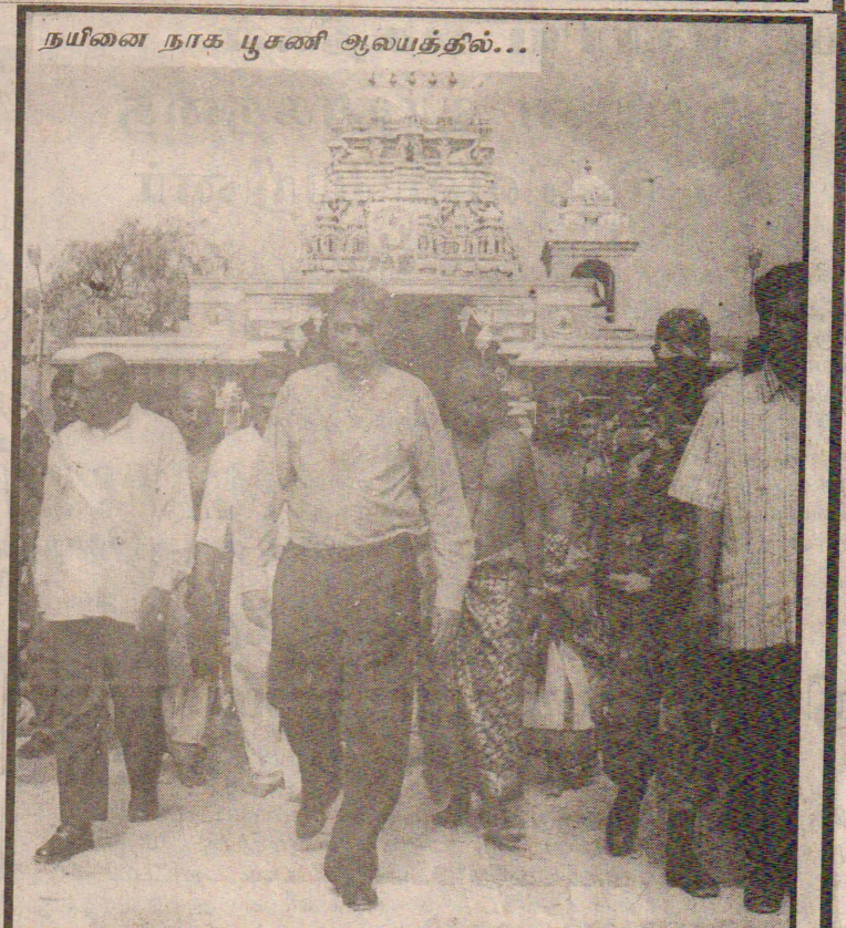
நயினை நாக பூசணி ஆலயத்தில்...