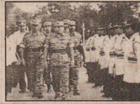
தமிழ் காவல் துறையின் 10வது ஆண்டு நிறைவை ஒட்டி இடம்பெற்ற காவல் துறையினரின் அணிவகுப்பு மரியாதையை தலைவர் பிரபாகரன் ஏற்றுக் கொள்ளும் காட்சி.