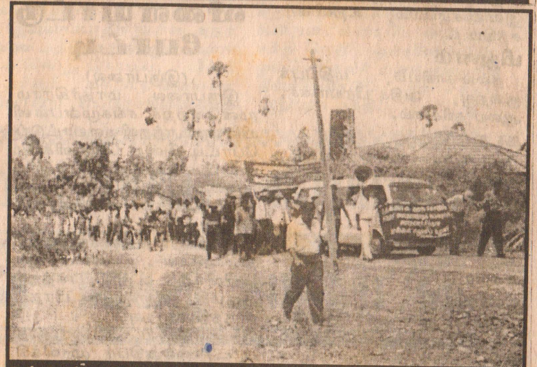
ஊர்காவற்றுறை நோக்கி பேரணி செல்லும் காட்சி (மேலதிக படங்கள் உள்பக்கத்தில்)

யாழ் துரையப்பா விளையாட்டரங்கில் இருந்து புறப்பட்ட மக்கள் எழுச்சி வாகனப் பேரணியில் யுத்த நிறுத்தக் கண்காணிப்புக்குழு முன்னே செல்ல வடபிராந்திய போக்குவரத் துச் சபை பஸ் வண்டிகள், பல்நோக்குக் கூட்டுறவுச் சங்க லொறிகள், தனியார் மினிபஸ் வண்டிகள், முச்சக்கர வண்டிகள். மோட்டார் சயிக் கிள்கள் எனப் பல்வேறு வாகனங்கள் கலந்து கொண்டன. வாகனத் தொடரணி அல்லைப் பிட்டிச் சந்தியைச் சென்றடைந்தது. அங்கு வழமையை விட ஏராளமான (10ம் பக்கம் பார்க்க)