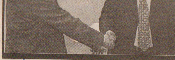
சர் ஹெல் க்சன் சந்தித்த போது எடுத்த படம்.

உள்ளே வர்ணக்கலண்டர் இன்றைய நாளை முதல் நாளுக்கு வர்ணக்கலண்டர் கேட்டு வாங்குங்கள்