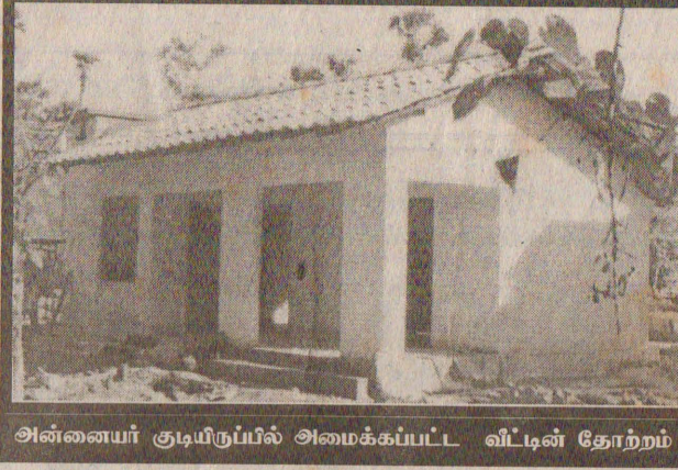
அன்னையர் குடியிருப்பில் அமைக்கப்பட்ட வீட்டின் தோற்றம்