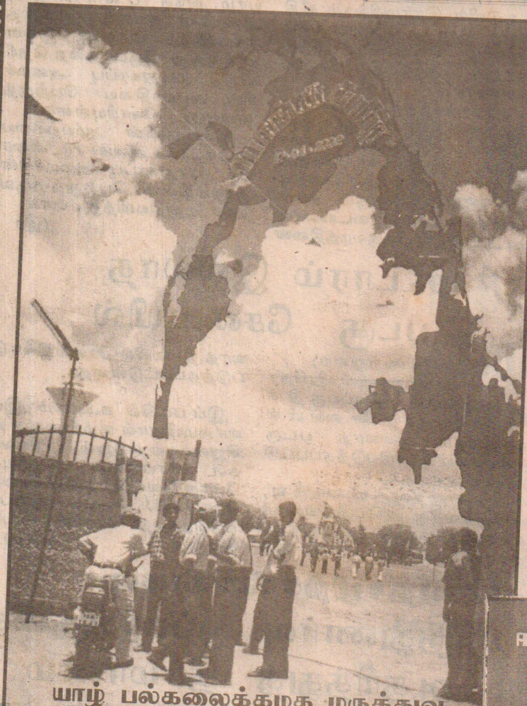
யாழ்ப்பாண பல்கலைக்கழக மருத்துவ பீட மைதானத்தின் நுழைவாயில்