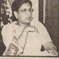
கட்டையாக அமையாது என ஜனாதிபதி கருதுவதாக ஜனாதிபதி

இவ்வகை அரசிற்கும் விடுதலைப் புலிகளுக்கு ஸ்பண்டான நேரடிப் பேச்சுவார்த்தைக்கு அவர்கள் மீதானது முட்டுக்கட்டையாக அமையாது என ஜனாதிபதி கருதுவதாக ஜனாதிபதியின் பேச்சாளர் தெரிவித்துள்ளார்.