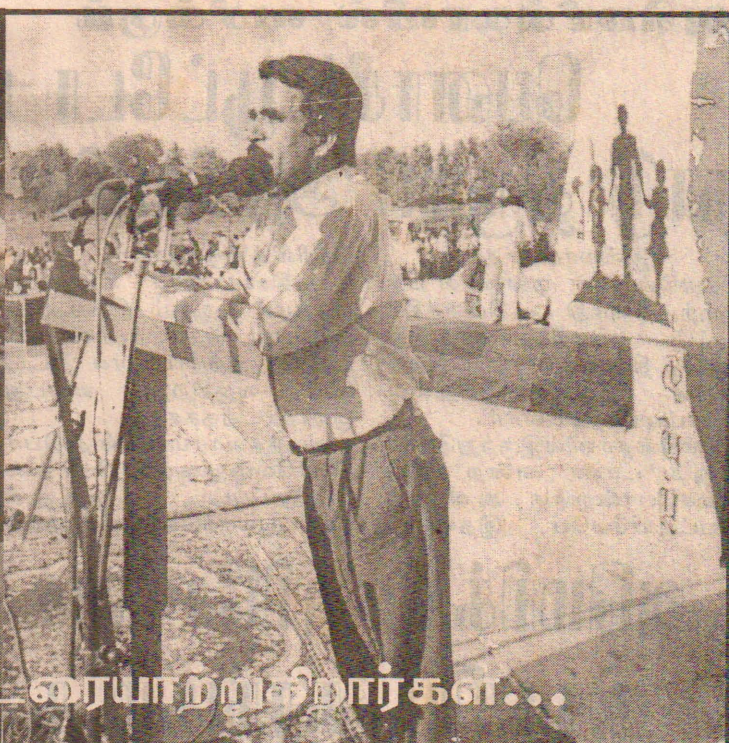
துணை தீவந்தர்கள் உரையாற்றுகிறார்கள்...