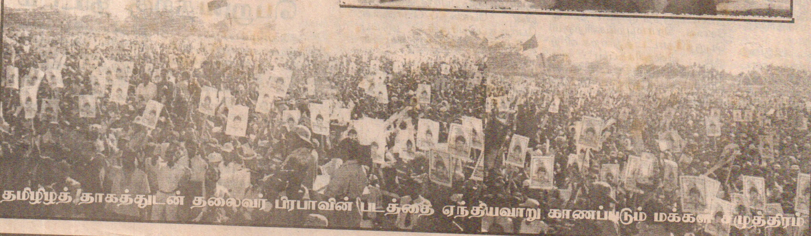
தமிழ் தாகத்துடன் தலைவர் பிரபாவின் படத்தை ஏந்தியவாறு காணப்படும் மக்கள் சமுத்திரம்