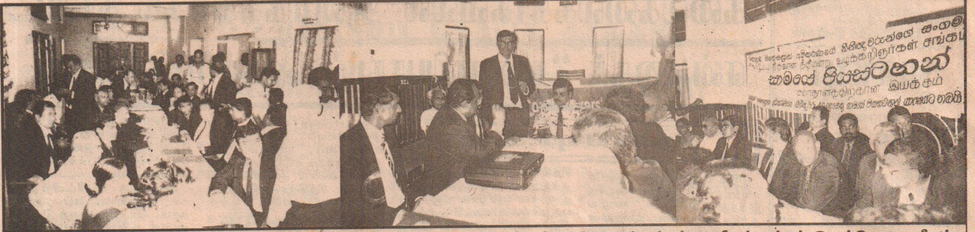
சமாதானத்தை வலியுறுத்தி யாழ் வந்த தென்னிலங்கை சட்டத்தரணிகள் குழுவினருக்கு யாழ் சட்டத்தரணிகள் சங்கம் இராய்போசன வீருந்து வழங்கியபோது எடுத்த படம்.