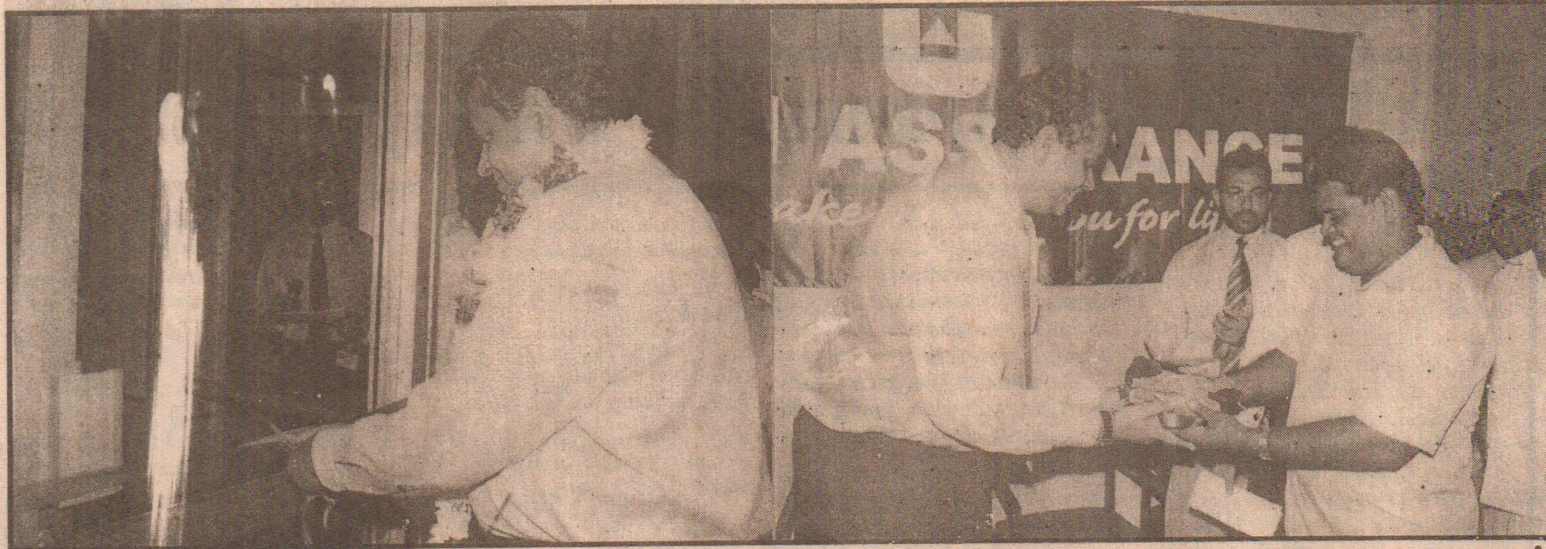
யுனியன் அஷ்யூரன்ஸ் லிமிடெட் கிளை நேற்று யாழ் நகரில் திறந்து வைக்கப்பட்டபோது எடுக்கப்பட்ட படங்கள்.