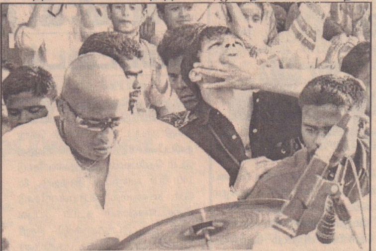
இசையால் பறந்த சனாமி சோக. சனாமியால் பாதிக்கப்பட்ட கடலூர் தேவனாம்பட்டினம் கடற்கரையில் உலகப் புகழ்பெற்ற டிரம்ஸ் சிவமணி வாசித்த பாடலுக்கு இந்தி நடிகர் விவேக் ஓபராய் விசிலடித்து ஆட்டம் போட்டார்.

(ஐம்முஹாஸ்) காஷ்மீரில் சர்வதேச எல்லை கடந்து பாகிஸ்தானுக்குள் ஊடுருவ முயன்ற 42 பேரை எல்லைப் பாதுகாப்பு படையினர் கைது செய்தனர். இது குறித்து எல்லைப் பாதுகாப்புப் படையின் செய்தித் தொடர்பாளர் கூறியதாவது: காஷ்மீரில் சாம்பா பகுதியில் உள்ள பாம்பியா என்ற இடத்தின் அருகே சர்வதேச எல்லை உள்ளது. இங்கு நேற்று முன்தினம் அதிகாலை 2.50 மணிக்கு வீரர்கள் வீதி நடவடிக்கைப் பணியில் ஈடுபட்டிருந்தனர். அப்போது சர்வதேச எல்லைப்பகுதிக்கருகே கும்பலாக சிலர் நின்றிருந்தனர். அவர்களை