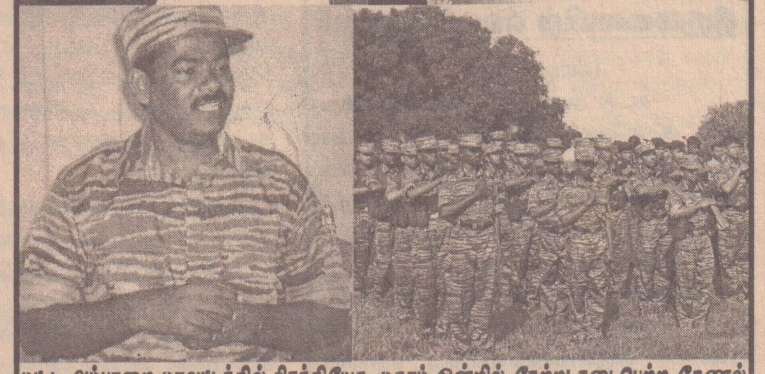
மட்டு அம்பாறை மாவட்டத்தில் பிரத்தியேக முகாம் ஒன்றில் நேற்று நடைபெற்ற கேணல் கிட்டு உட்பட 10 வேங்கைகளின் 12வது ஆண்டு நினைவு நாள் நிகழ்வு காட்சிகள்.