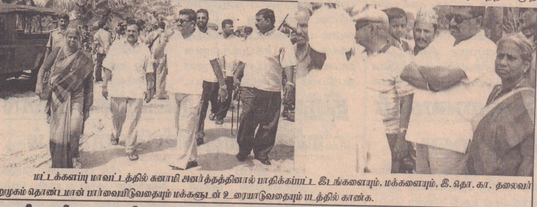
மட்டக்களப்பு மாவட்டத்தில் சுனாமி அணர்த்தத்தினால் பாதிக்கப்பட்ட இடங்களையும், மக்களையும், இ.வெ.கா. தலைவர் சூறாமும் தொடர்பான பார்வையிடுவதையும் மக்களுடன் உரையாடுவதையும் படத்தில் காண்க.

(நமது நிருபர்) சட்ட விரோதமாக 23 லட்சம் பெறுமதியான இரத்தினக் கற்களை பாதணிக்ஞர் மறைத்து வைத்துக் கொண்டு நாட்டுக்குள் கடத்த முயன்ற இரண்டு வர்த்தகர்கள் கட்டுநாயக்க விமான நிலையத்தில் சங்கு அதிகாரிகளினால் கைது செய்யப்பட்டுள்ளனர்.