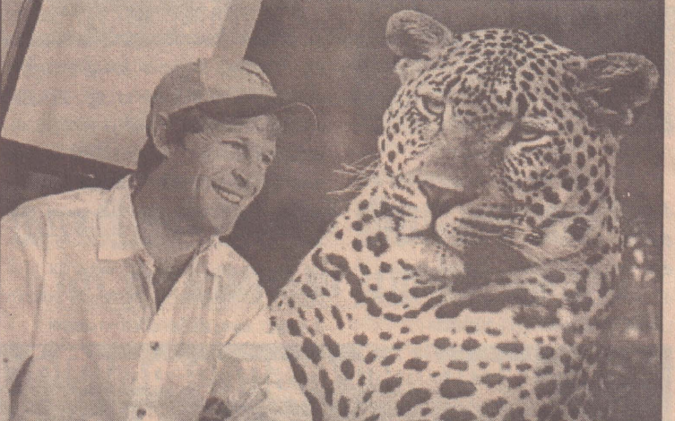
தென்னாபிரிக்க அணிக்கான வீரர்கள் தேர்வில் மாற்றம் கொண்டு வர வேண்டும் என ஜோன்டி ரோட்ஸ் வலியுறுத்தியுள்ளார்.

நேற்று முன்தினம் மும்பை வந்த இவர் கூறியதாவது கிரிக்கெட் உலகில் தென்னாபிரிக்க அணி சிறந்து விளங்க வேண்டுமானால், வீரர்கள் தேர்வு முறையில் மாற்றம் வேண்டும். சீர்திருத்தம் என்ற பெயரில் வீரர்களை அடிக்கடி நீக்குவது சரியல்ல. திறமை இருந்தும் பீட்டர்சன், குளுஸ்னர் க்கு வாய்ப்பு கிடைக்கவில்லை.