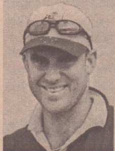
ஹைடன். இப்போது தேறி விட்டாராம். அவுஸ்திரேலிய கிரிக்கெட் அணி இன்று நியூசிலாந்து பயணம் செல்கிறது. இந்தத் தொடரில் பங்கேற்கிறார் ஹைடன்.

நுரையீரல் வீக்கத்தால் அவதிபற்றி அவுஸ்திரேலிய கிரிக்கெட் வீரர் மேத்யூ ஹைடன் கொஞ்சம் உடம்பு தேறியிருக்கிறார். அவுஸ்திரேலிய கிரிக்கெட் வீரர் மேத்யூ ஹைடனுக்கு இரண்டு பிரச்சினைகள். சமீபகாலமாக கிரிக்கெட்டில் சொல்லிக் கொள்ளும் படி ஸ்கோர் செய்யவில்லை. அதை விட முக்கியம் உடம்பும் சரியில்லை. நுரையீரல் சவ்வு பகுதியில் ஏற்பட்ட வீக்கம் காரணமாக மிகவும் கஷ்டப்பட்டார்