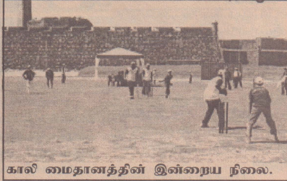
காலி மைதானத்தின் இன்றைய நிலை.