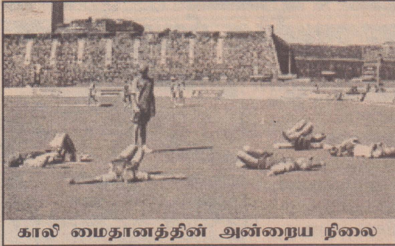
காலி மைதானத்தின் அன்றைய நிலை