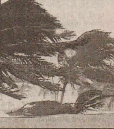
மெக்ஸிகோவில் பதவான வானிலை அளவீன்படி நேற்று முன்தினம் மணிக்கு 181கி.மீ வேகத்தில் காற்று வீசியது கிந்தப்பயல் காரணமாக 40ஆயிரம் மக்கள் கமது கிருப்ட்டங்களை விட்டு பாதுகாப்பான இடங்களில் தங்க வைக்கப்பட்டிருந்தனர்.

சுற்றுலா, மனிதவள மேம்பாடு, சுகாதாரம், பயங்கரவாதத்தை முறியடித்தல் மற்றும் பாதுகாப்பு விடயங்களில் ஒத்துழைப்பை மேம்படுத்தல் என்பவை தொடர்பான விடயங்கள் ஆராயப்பட்டதும் இங்கு குறிப்பிடத்தக்கது. நேற்று மாலை மாலைத் தீவில் அளித்த விருந்தில் கலந்து கொண்ட வாஜ்பாய் பேசுகையில் பயங்கரவாதம் பற்றிய சார்ச் நாடுகளின் தீர்மானத்தை தற்போது நிலைமைக் கேற்ப மாற்றியமைப்பது அவசியம் என்று கூறிய வாஜ்பாய் இப்பிரச்சினையை விவாதிக்க அமைச்சர் நிலைக்கூட்டம் ஒன்றை நடத்துவதற்கு இந்தியா யோசனை நடத்தியுள்ளது என்றும் கூறினார்.