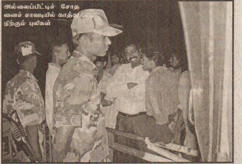
அல்லைப்பிட்டிச் சோதனைச் சாவடியில் காத்திருக்கும் புலிகள்