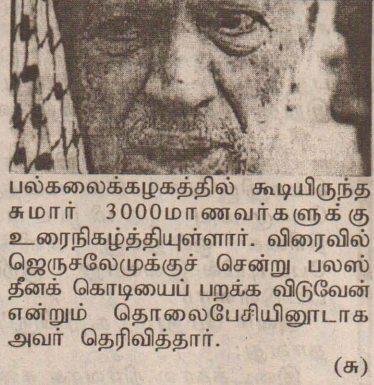
பல்கலைக்கழகத்தில் கூடியிருந்த சுமார் 3000 மாணவர்களுக்கு உரைநிகழ்த்தியுள்ளார். விரைவில் ஜெருசலேமுக்குச் சென்று பலஸ்தீனக் கொடியைப் பறக்க விடுவேன் என்றும் தொலைபேசியினூடாக அவர் தெரிவித்தார்.