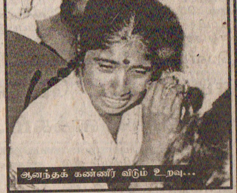
ஆனந்தக் கண்ணீர் விடும் உறவு...