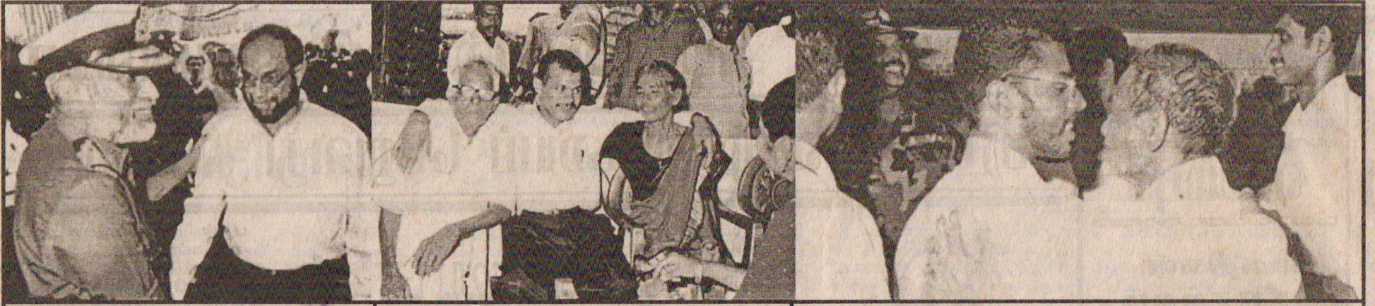
கடற்படைத்தளபதியுடன் போயா கொட