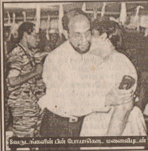
8 வருடங்களின் பின் போயாகொட மனைவியுடன்