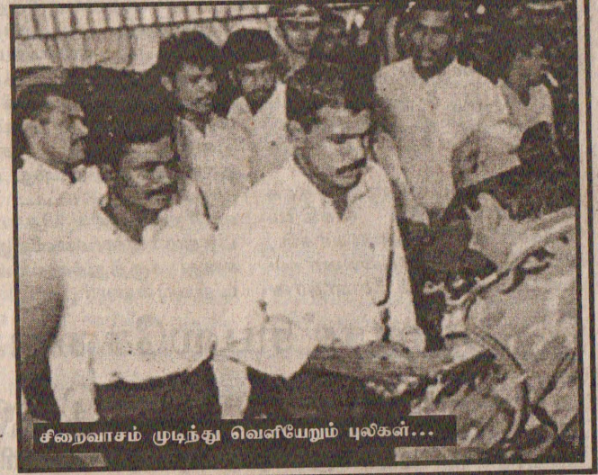
சிறைவாசம் முடிந்து வெளியேறும் புலிகள்...