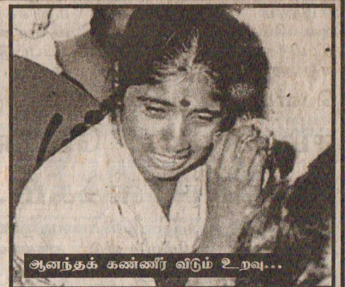
ஆனந்தக் கண்ணீர் வீடும் உறவு...

இக் கைதிகளின் பரிமாற்றத்தின் போது விடுதலைப்புலிகள் 7படையினரையும், அரசு 13 விடுதலைப்புல உறுப்பினர்களையும் உறவினர்களின் சந்தோஷ உணர்ச்சிப் பிரவாகத்தின் மத்தியில் விடுதலை செய்தனர்.