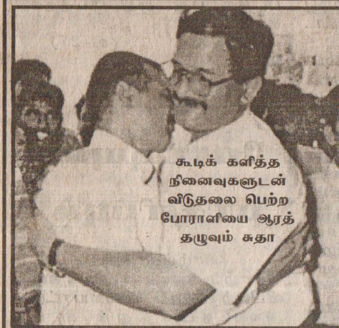
கூடக் களித்த நினைவுகளுடன் விடுதலை பெற்ற போராளியை ஆரத் தழுவும் சுதா